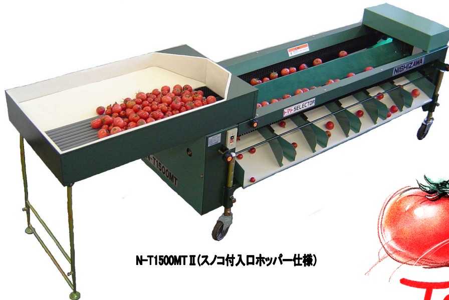
N-T1500M II (スノコ付入口ホッパー仕様)