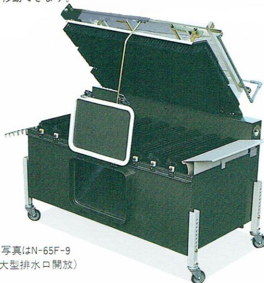
写真はN-65F-9 (大型排水口開放)