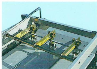
▲上押えロッドタイプ